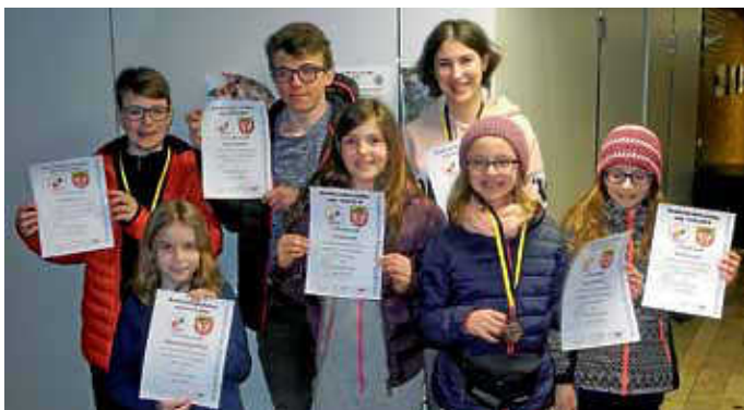
Teilnehmer an den Bezirksmeisterschaften

Platz 1 berechtigt zur Teilnahme bei den Landesmeisterschaften in Biberach, die Zweitplatzierten müssen im Nachrückverfahren noch um die Teilnahme zittern.